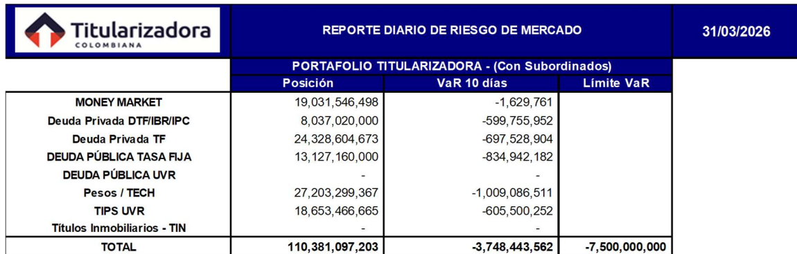
Cuadro [3]. Reporte diario de Riesgo de Mercado con corte 31/03/2026

A continuación, se relaciona la composición del portafolio y Var 10 días a corte de 31 de marzo de 2026.