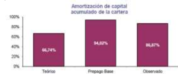
Gráfico No. 3: Amortización de capital acumulada a julio de 2013

La emisión TIPS E-8, a diferencia de las emisiones anteriores, permite que los créditos puedan ser renegociados a una tasa mínimo de UVR +7,8%, lo que permitió que el nivel de prepago fuera inferior al de las emisiones más antiguas. Al igual que en otras emisiones calificadas por BRC, el capital de la emisión de los TIPS E-8 presentó una reducción mayor a la esperada por Titularizadora Colombiana S. A. a agosto de 2013, el 86,87% del capital de la cartera se ha amortizado frente a una amortización calculada de 66,74%, usando un nivel de prepago de referencia de 13,10% (ver Gráfico No. 3).