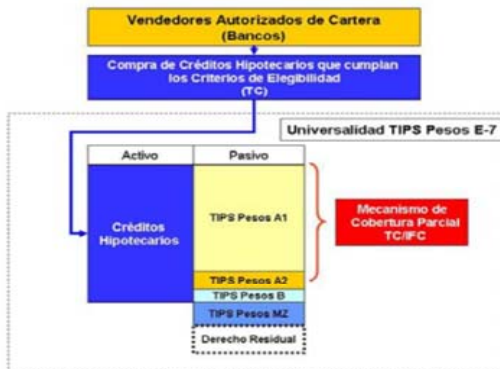
Gráfico No. 2: Estructura de la Emisión TIPS Pesos E-7

El activo subyacente de la emisión está conformado por los créditos hipotecarios No VIS 5 , con todos los derechos principales y accesorios que se derivan de los mismos, entre otros, los derivados de los prepagos de los créditos hipotecarios, la recuperación de capital en mora por dación en pago o adjudicación en remate, la ventas de Bienes Recibidos en Dación de Pago (BRP), los recaudos por remates a favor de terceros de garantías hipotecarias, los saldos a favor en procesos de sustitución de créditos hipotecarios, los pagos recibidos por concepto de la recompra de créditos hipotecarios, los pagos recibidos por concepto de la cesión de créditos hipotecarios, los derechos sobre los seguros, los activos o derechos derivados o relacionados con el Contrato de Mecanismo de Cobertura Parcial con Titularizadora Colombiana S. A. y con IFC, y cualquier otro derecho derivado de los créditos hipotecarios o de sus garantías.